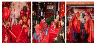
1. 一拜天地 (イバインディ) 天と地の神様に礼 2. 二拜高堂 (アバイガオタン) 両親に礼 3. 夫妻对拜 (フツヅェイ) 夫婦お高いに礼